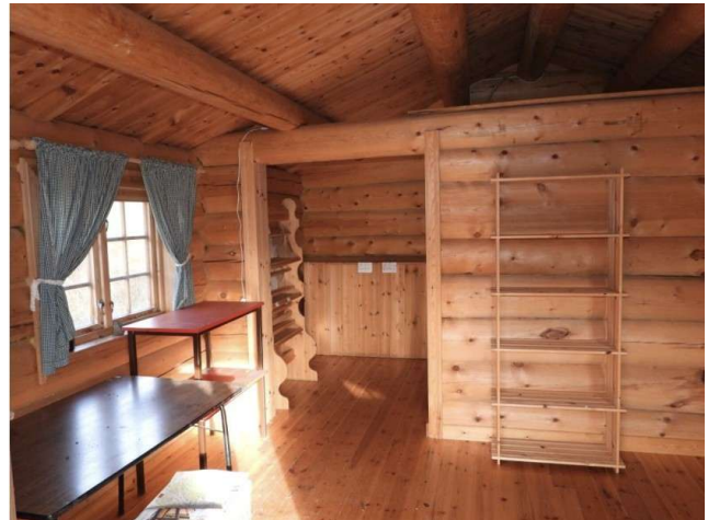
Hovedrommet med hems over ene delen.