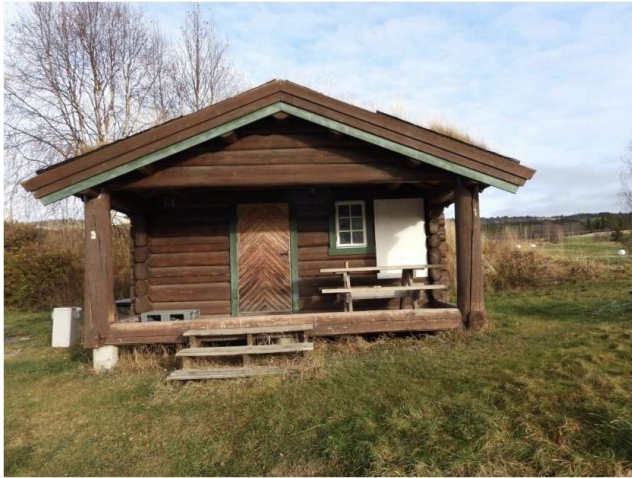
Fronten med inngangsparti.