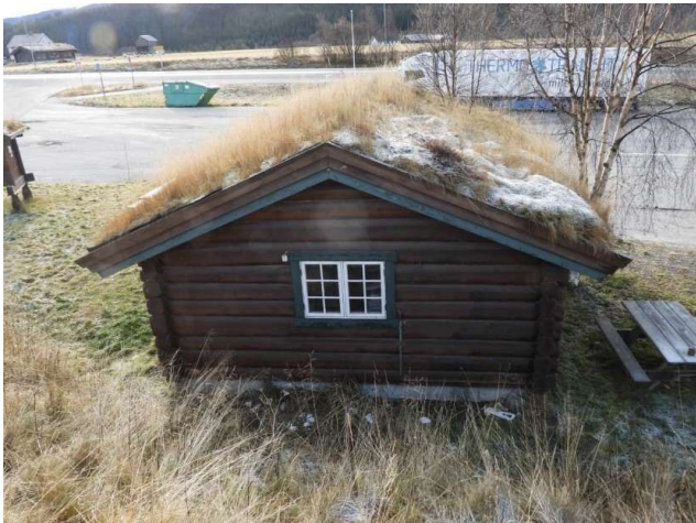
Hytta sett fra baksiden.