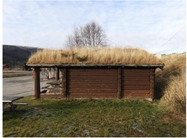
Hytta sett fra siden.